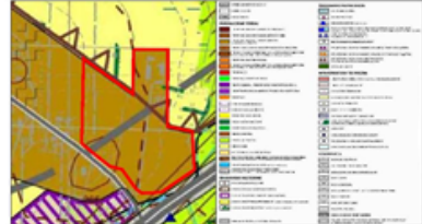
GRANICA OBSZARU OBJĘTEGO ZMIANĄ PLANU

MAPA ZASADNICZA WYKONA PRZEZ STANOWISKO PLANIMETRYCZNE LICENCJA NR 04.000.00.0017_000_011